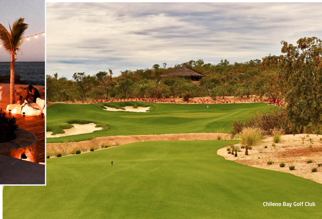
Chileno Bay Golf Club

Chileno Bay ist eine kleine Bucht oberhalb von Los Cabos an der Sea of Cortez. Die Discovery Land Company aus Texas hat die einst verschlafene Bucht mit öffentlichem Strand mächtig aufgemöbelt und ein sehr feines kleines Resort mit Weltklasse Golfplatz von Tom Fazio installiert.